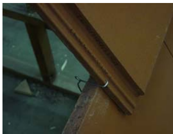
Crochet dans nervure double emboîtement latéral