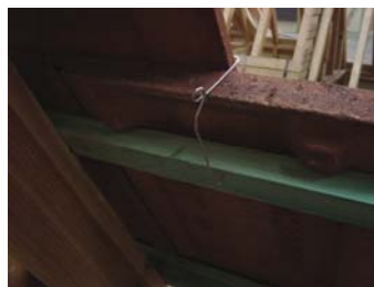
Fixation en dessous du liteau