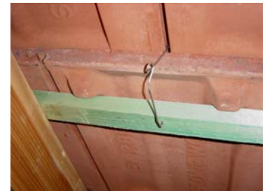
E-CLIPS Type 2 couvert par une tuile